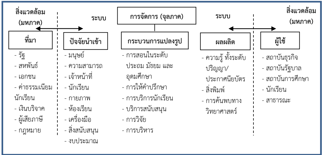
ภาพที่ 1 ระบบจัดการศึกษาทั้งในมุมมองมหภาคและจุลภาคของ Smith

ปัจจัยที่มีผลต่อการจัดการศึกษาในภาพรวมของประเทศไทย